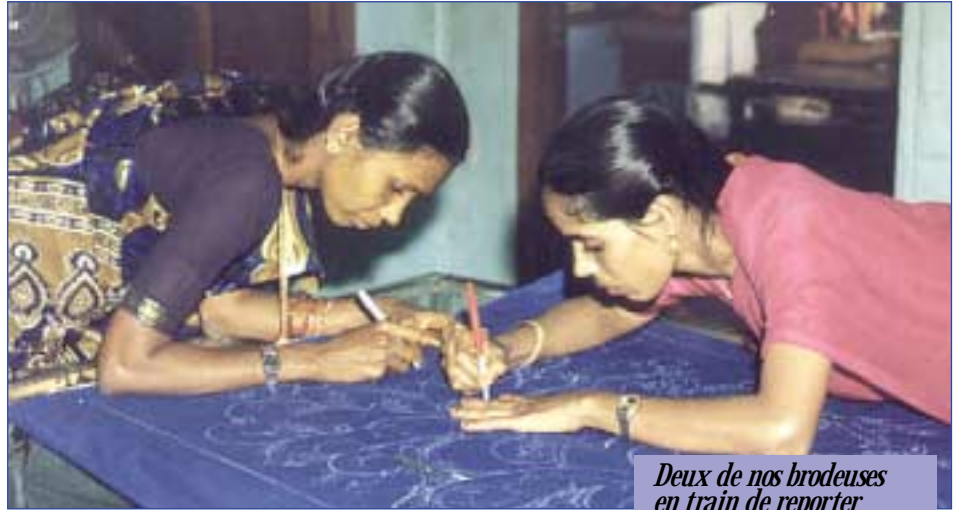
Deux de nos brodeuses en train de reporter les dessins du calque sur le tissu de la toile.

Apporter du travail et améliorer la condition de vie de nos brodeuses, a toujours été notre souci principal. C'est ce que nous essayons de faire depuis toujours. Ces dix dernières années ont apporté aux ouvrières un soulagement sensible: augmentation de salaires et renforcements des avantages sociaux, sans pour autant faire d'elles, des « privilégiées ». Par rapport aux transferts de fonds de 1990, nous avons aujourd'hui doublé le montant!