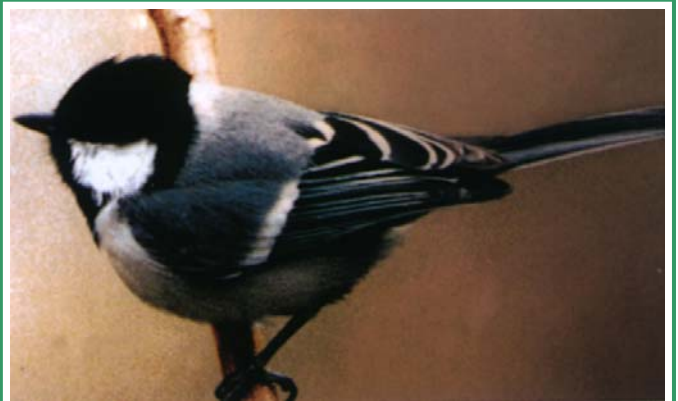
Mésange grise - Parus Najor

Ces oiseaux réalisent de véritables prouesses acrobatiques : ils regardent sous les feuilles, piquent le bec au fond des fleurs et grattent le bois à la recherche d'insectes. Quelle vision charmante que celle de ces petits oiseaux suspendus et accrochés périlleusement au bout des branches, ou encore en train de grignoter des baies, dérobées aux arbres. Les mésanges se laissent en général facilement approcher et on peut les observer de près.