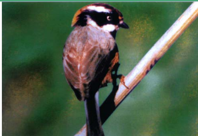
Mésange à tête rouge - Aegithalos Cocinnus

Les mésanges sont des oiseaux méthodiques et fouineurs qui scrutent chaque feuille et chaque branche pour repérer des chenilles et autres menus insectes dont elles sont particulièrement friandes. Elles examinent chaque feuille minutieusement avant de passer à une autre feuille. Leurs pattes puissantes leur permettent de s'agripper aux branches et même de se retourner. Les mésanges, très agiles et légères, se maintiennent suspendues dans l'air de manière extraordinaire.