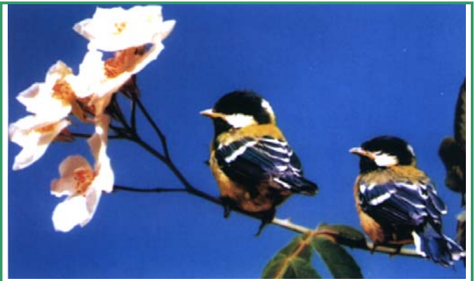
Mésanges à dos vert - Parus Monticolus