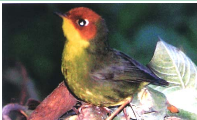
Mésange de feu - Cephalopyrus Slammiceps