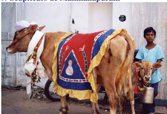
10/ Fête de la vache

C'est aussi la découverte d'une multitude d'activités artisanales de transformation : salines, carrières de pierres, fabriques de briques, fileurs de cordes de fibres de coco ou d'agave, producteurs de sucre de canne, tisserands, etc.