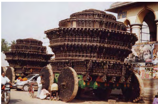
6/ Impressionnant char sacré