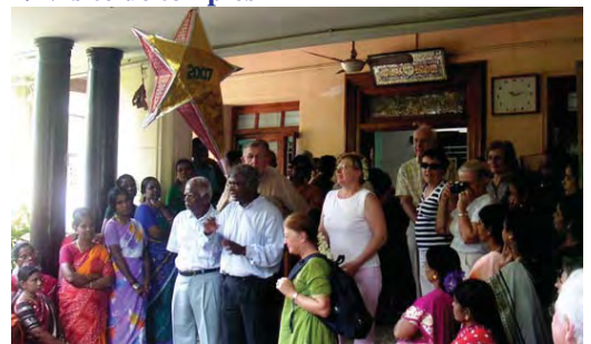
3/ Accueil à l'Atelier