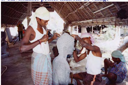
9/ Sculpteurs de Mahmallapuram