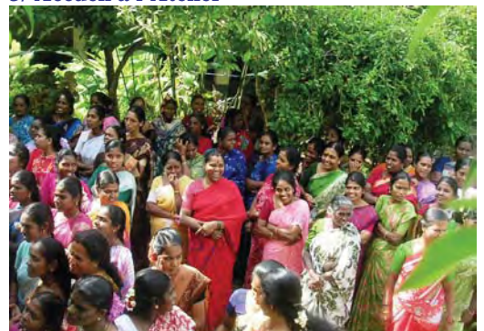
4/ Les brodeuses