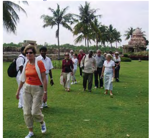
2/ Visite de temples