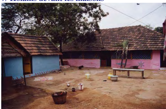
8/ Ravissantes petites maisons de village