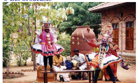
5/ Danse folklorique du Kerala