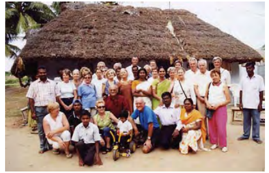
1/ Chez Sivagami